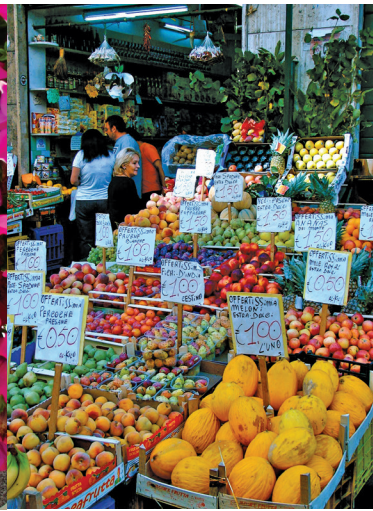
// Étal de marché du Testaccio