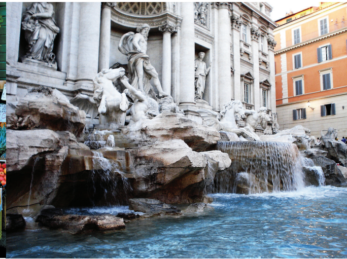
// La fontaine de Trévi