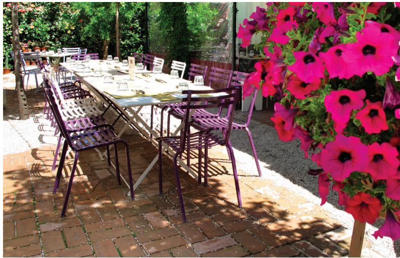
// La terrasse du Cucina Rosti