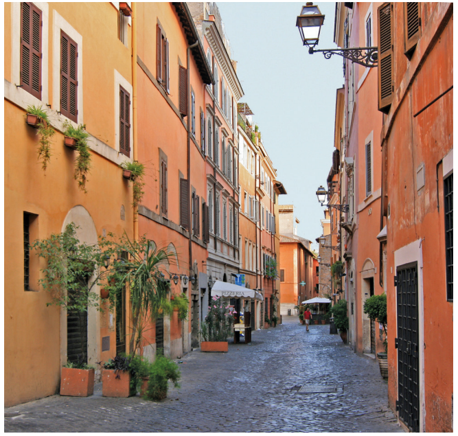
// Les petits rues du Trastevere

Entre flâneries et bonnes adresses pour déambuler à travers ses rues étroites et alambiquées, ses fontaines majestueuses et son climat festif et joyeux, voici notre top 7 de la capitale :