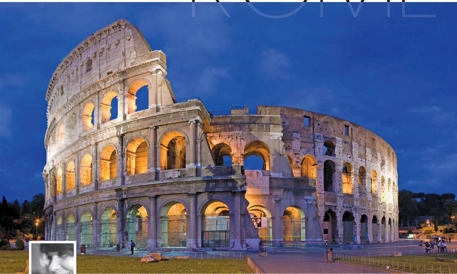
// Le colisée de Rome