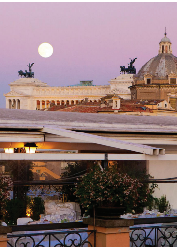
// La terrasse du Grand Minerve (DR)

Comme un romain. Pour ne pas louper l'occasion de chiner, le dimanche allez aux puces de Porta Portese à Trastevere. Mélange de vide grenier et de brocante, vous pouvez même acheter des épices et de la mozzarella . Plus authentique, mixé et tendance, le marché du Testaccio. Friperie, brocante, marché d'antiquités, mais aussi alimentaire (pizzas, paninis, fruits et légumes).