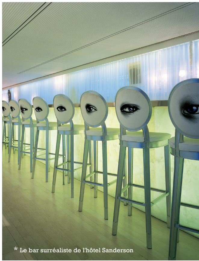
* Le bar surréaliste de l'hôtel Sanderson