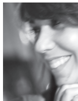
Texte : Juliana de Giacomini

Si une envie subite de changer d'air vous envahissait, « keep calm and go to London » ! Pas la peine de changer de travail ou de maison pour se créer un nouvel état d'esprit, parfois deux heures d'avion suffisent pour un dépaysement complet ! Easy jet a rapproché Londres de Montpellier et c'est tant mieux, car il y a toujours du nouveau à découvrir dans cette ville « so british » ! La capitale anglaise abrite plusieurs univers culturels aussi différents que complémentaires.