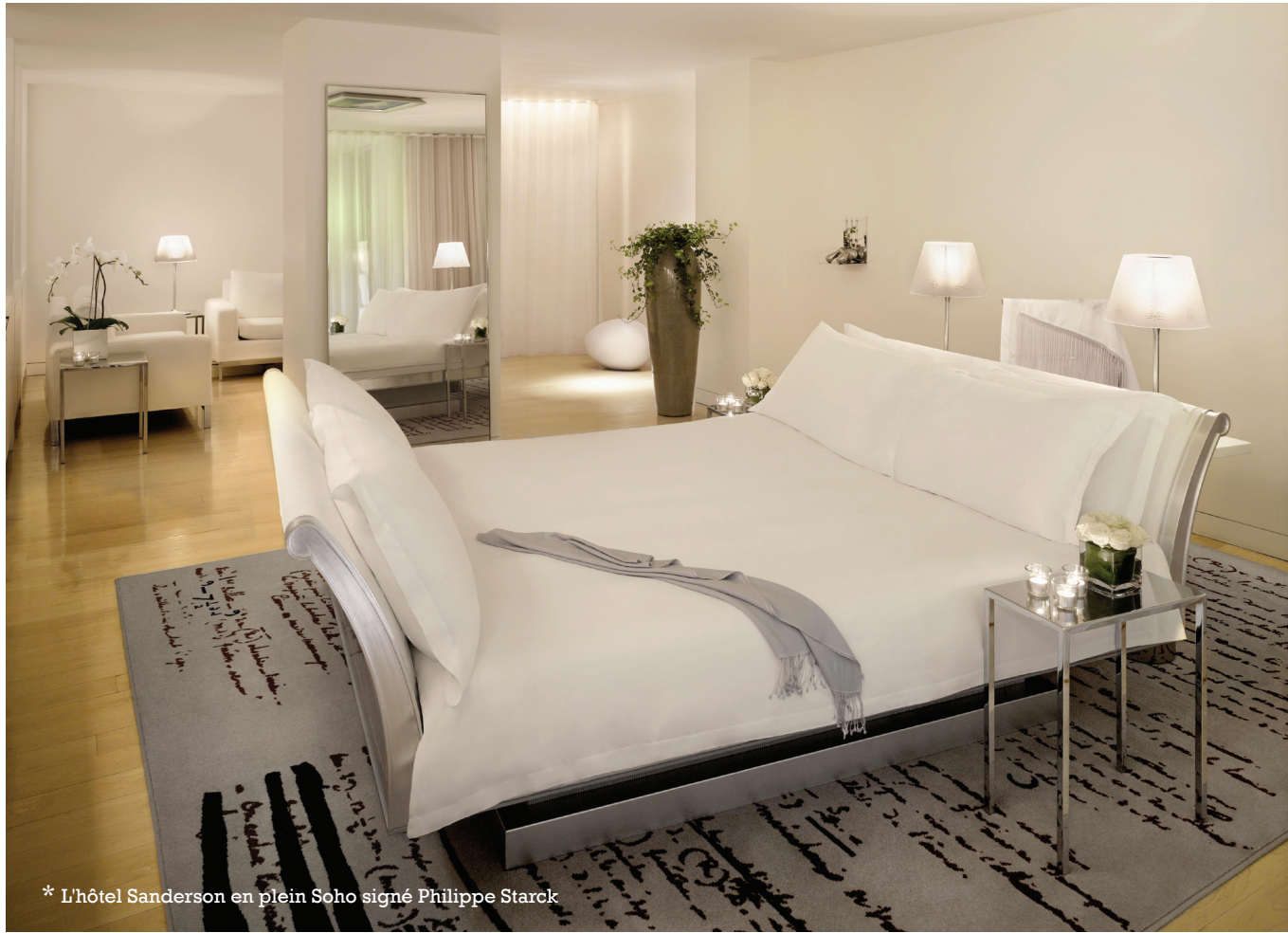
* L'hôtel Sanderson en plein Soho signé Philippe Starck