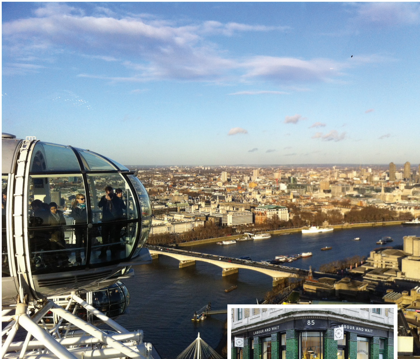
* London Eyes et sa vue spectaculaire.