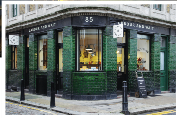
* Labour&Wait, la boutique vintage

Le choix d'hébergement est aussi une expérience à part. Des hôtels pour tous les goûts et budgets. Du classique au plus contemporain, la ville offre un vaste choix de possibilités, dont l'hôtel Sanderson en plein Soho, le quartier multiculturel avec pubs, magasins et... sex shops. Avec un style urbain exceptionnel marqué par une mise en scène théâtrale, le lieu mélange inspiration baroque, rock et minimalisme contemporain. Les Français se sentiront chez eux car il a été conçu par Philippe Starck. Petit bonus, chaque chambre dispose d'une vue panoramique sur Londres et donne sur un jardin intérieur paysagé et verdoyant, à ciel ouvert.