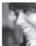
Texte : Juliana de Giacomini Son blog à suivre : decouvrirdesign.com