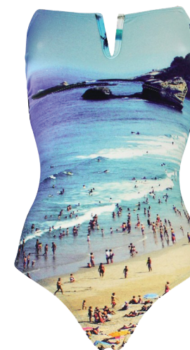
Maillot de bain, Albertine chez Soon, Montpellier

Pour démarrer cette rubrique stylée, rien de mieux qu'une immersion dans les tendances phares printemps-été 2014. De l'inspiration rétro à l'incontournable style californien, en passant par les imprimés flamants roses et ananas, les looks et décors du moment s'invitent chez nous. La mythologie californienne semble plus que jamais attirer des foules. Pour la mode, l'arrivée chez Kenzo du duo californien Humberto Leon et Carol Lim, fondateurs d'Opening Ceremony, est sans aucun doute à l'origine de ces nouvelles collections, inspirées des cultures diverses et variées de la Californie.