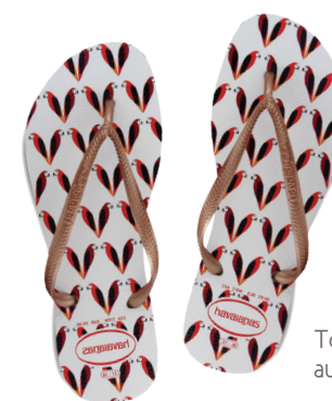
Merci aux boutiques Bensimon Home Autour du Monde, Vue d'intérieur et Soon pour leur accueil.

Une envie subite de quitter la ville le temps d'un week-end... direction Palm Springs ? Accordez vous un brin de nostalgie et de bonne humeur pour des ambiances qui sentent le sable chaud et l'été !