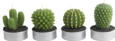
Bougies Cactus little 2 chez Fly